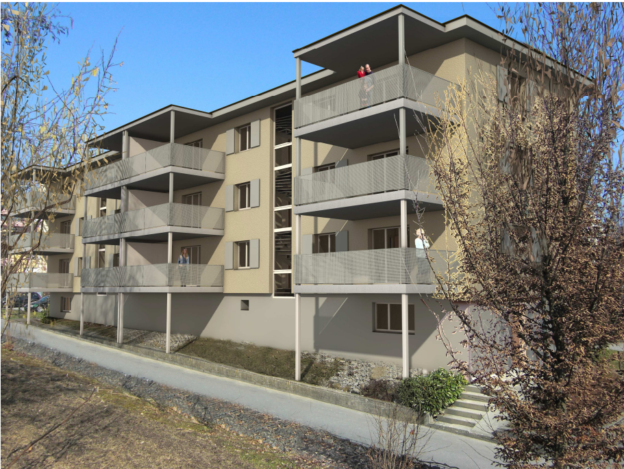
Visualisierung nach Anbau Balkone/Sanierung Gebäudehülle

Diese Sanierung ist die logische Weiterführung des aktuellen Bauprogrammes. Das längerfristige Bauprogramm sieht vor, dass voraussichtlich im Jahr 2014 das Haus Pilatusring 11 dem gleichen Facelifting unterzogen wird. Baubeschlüsse sind selbstverständlich noch keine getroffen worden.