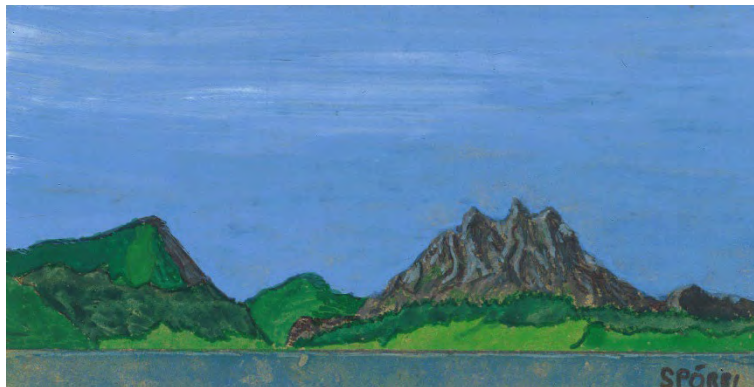
Pilatus von Küssnacht aus